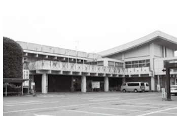
元田沼庁舎(本館部分)