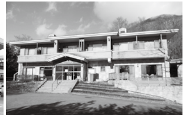
元レイクサイド佐野