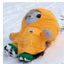
市こどもの国（堀米町）