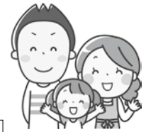
◀ほめトレ動画 (群馬県制作)