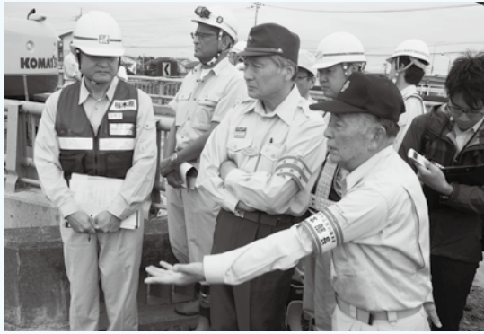
知事に秋山川決壊現場を説明