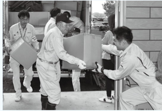
救援物資の受け入れ