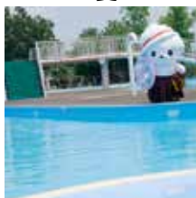
市運動公園市民プール（赤見町）