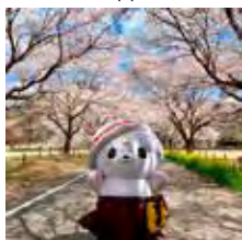
根古屋森林公園（飛駒町）