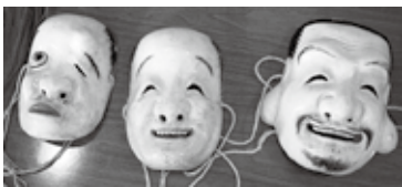
左から、神楽面「ひよっこ(兄)」、「ひよっこ(弟)」、「蛭子大神」