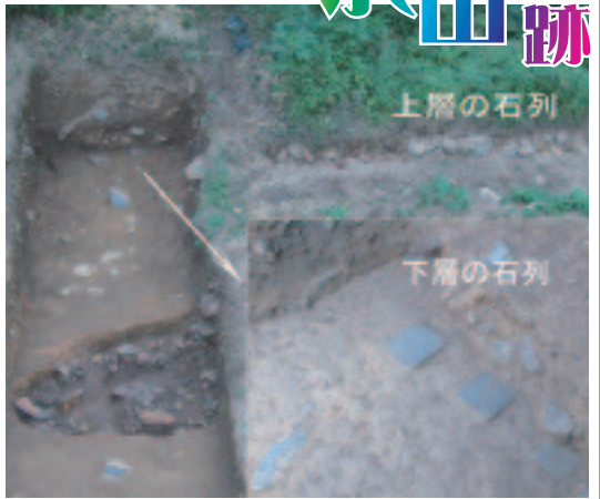
▲発見された2つの石列

まず、御台所北東縁辺部の地表近くで、30m以上にわたり石列を確認しました。更にその下層から、一辺20〜30cmで長方形の平石4つが1列に並んで発見され、表面は水平に据えられています。上部の石列とは異なる時期、性格のもので、詳細は不明ですが、下層の石列は、庭園などの足場に使用される飛び石の可能性も考えられます。将来的な調査による解明に期待がかかります。