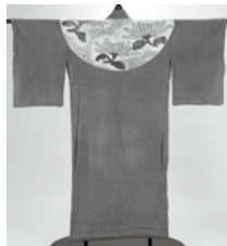
歌舞伎衣裳 「弁天小僧菊之助」

▶入館料＝無料 ▶休館日＝ 毎週月曜日(10月12日は開館)、 10月13日(火)