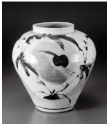
田村耕一 《鉄絵竹鷲文壺》 当館蔵

▶休館日＝毎週月曜日(10月12日、11月23日は開館)、 10月13日(火)、11月4日(水)、24日(火)