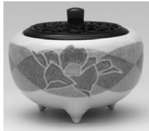
宮之原謙 《彩盛上紅椿香炉》 当館蔵

▶休館日=毎週月曜日、2月12日(木)、2月19日(木)~27日(金)まで展示替え休館