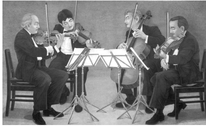
▲塚原哲夫 《弦楽四重奏》、2005年 当館蔵（新収蔵品）