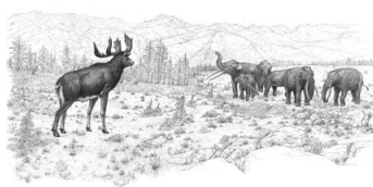
▲氷期の様子(復元図)