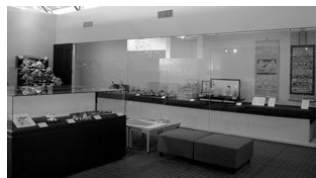
▲前回雛人形展の様子