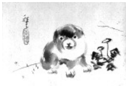
平福百穂《十二支(戌)》