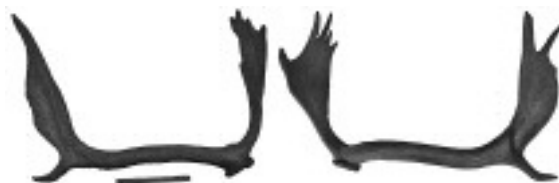
竜骨とされたヤベオオツノジカの角

かつて地中から見つかる大きな動物の骨は竜の骨と考えられ、めでたいものとされていました。化石館にて竜骨展示中です。