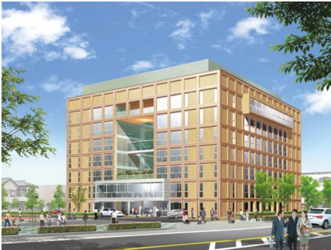
佐野市新庁舎（南東からの外観イメージ）