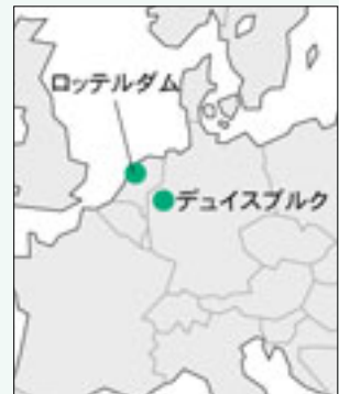
ドイツの内陸に位置するデュイスブルク港