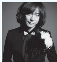
ダイヤモンド☆ユカイさんは9日登場!