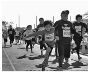
手をつないでゴールする親子マラソン