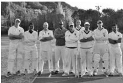
在日英国大使館チームの皆さん

11月23日、イギリス発祥のスポーツ「クリケット」の日本伝来150周年を記念する「佐野英国祭」が、旧県立田沼高