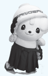
さのまるも3日間登場する予定です