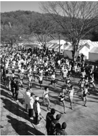
フルマラソンのスタート