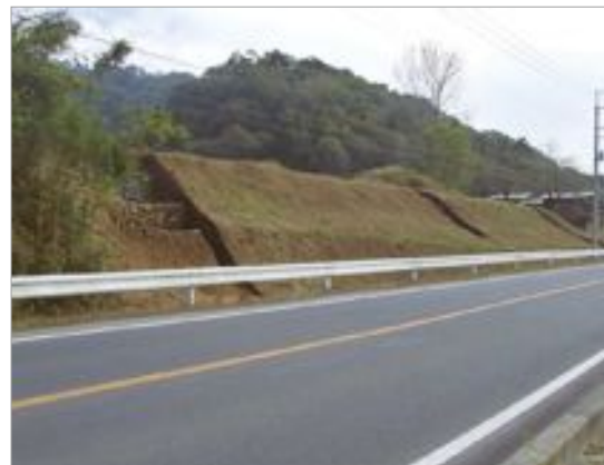
発掘調査により、史料に記された屋敷跡が確認されました