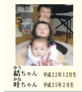
ゆう 結ちゃん 平成22年12月生 かな 叶ちゃん 平成25年2月生