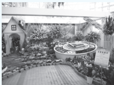
主催者テーマ展示(前回)