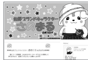
▲さのまるブログや予定表も随時更新しています！