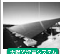
太陽光発電システム