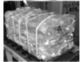
▲圧縮梱包された ペットボトル