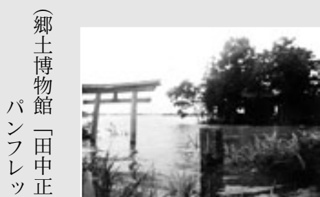
水没した谷中村 (雷電神社付近)