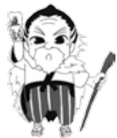
イメージキャラクター しょうぞう (SHOZO) くん

市では、関係団体などと協力して正造翁の偉業を広く顕彰し、永く後世に伝えるため、さまざまな事業に取り組んでいます。