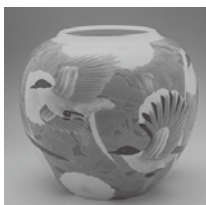
齊藤勝美 《彩磁朝鮮朝顔二尾長群翔文大壺》当館蔵