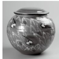
田村耕一《青磁草原に鷲蓋付大壺》 当館蔵