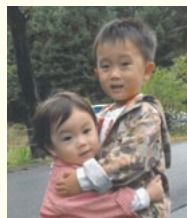
もとき 礎ちゃん 平成23年11月生

※広報さの1月1日号に掲載した男女の人口に誤りがありました。 11月1日時点の人口は、男性60,649人・女性62,279人です。訂正お詫びします。