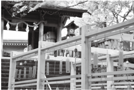
天明鋳物とコラボレーションした「風鈴参道」