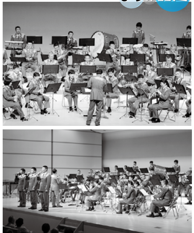
演奏にあわせ、隊員が歌声を披露する場面もありました