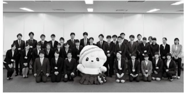
平成29年度採用職員