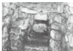
トコチ山古墳の石室