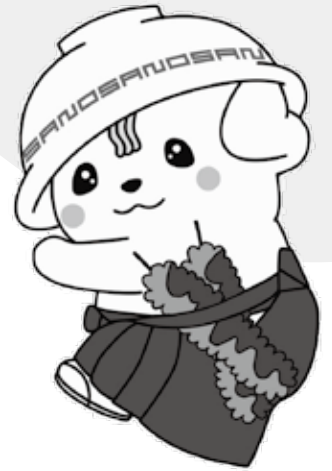
佐野ブランドキャラクター さのまる

美容師になるためには、国家試験に合格しなければなりません。毎日の学習に一生懸命取り組み、夢の実現に向けて頑張りたいです。