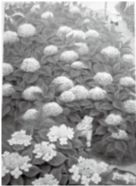
安藤勇次《かくれんぼ》 ※新作原画展では展示されていません

御神楽町にある安藤勇次「少年の日」美術館は今年で開館15周年を迎え、「新作原画展」を8月27日まで開催しています。