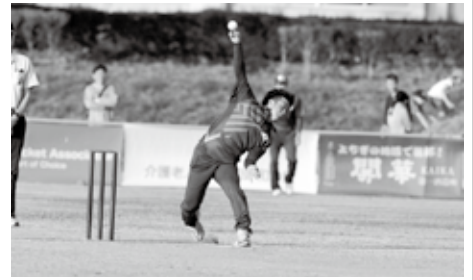
肘を曲げないで投球する日本代表選手

クリケットは野球の原型と言われますが、大きく異なる特徴が3つあります。1つ目は投手が助走をつけて、肘を曲げずに投球すること。2つ目は打者が360度どの方向に打っても良く、ファールがないこと。3つ目は守備が素手でボールをキャッチすることです。