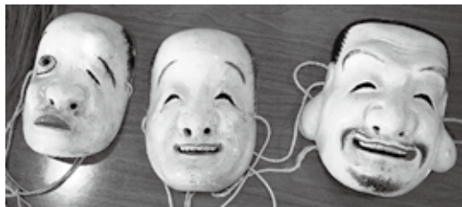
左から、神楽面「ひよっこ(兄)」、「ひよっこ(弟)」、「蛭子大神」