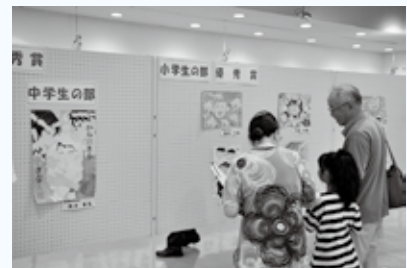
昨年度の様子 展示室↑・表彰式↓

午後3時30分～8時30分 佐野市小中学生人権啓発ポスター展入賞作品、 佐野市小学生人権書道展入賞作品の展示