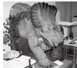
トリケラトプス 模型