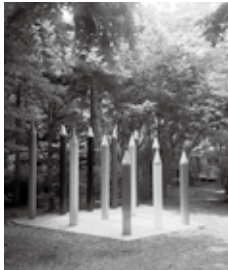
美術館の外には色鉛筆のオブジェがあります