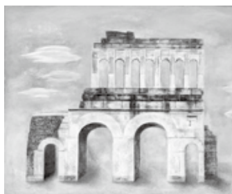
高橋久雄《アルーの門》 個人蔵 2016年