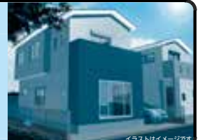
イラストはイメージです