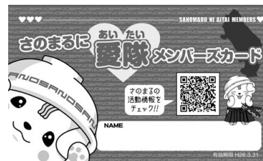
▲メンバーズカード(見本)