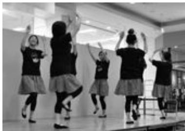
考案したさのまる音頭を披露

17日には「さのまる音頭」の振り付け発表の審査会が行われ、5組が出場。2組が実際にステージで披露し、残り3組は踊りを収録したDVDで踊りを披露しました。「さのまる音頭」の振り付けは、今後、審査会を経て、決定する予定です。どうぞ、ご期待ください。