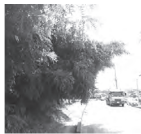
歩道にせり出た支障木

歩道や車道に張り出した樹木は、歩行者や自動車の通行の妨げになり危険です。また、枯れ木や弱った木が倒れて事故が発生した場合、所有者が責任を問われます。私有地の樹木の所有者は、適正な管理をお願いします。