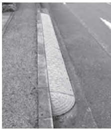
違法に設置された段差解消ステップ

道路に段差解消ステップや看板、のぼり旗などを設置することは、違法です。道路の段差解消ステップや看板、のぼり旗などの不法占用物の所有者は、撤去をお願いします。