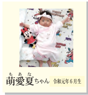
もあな 萌愛夏ちゃん 令和元年6月生

※次回の「アイドル登場」の掲載は4月号です。次号では「とどけ夢未来へ」を掲載します