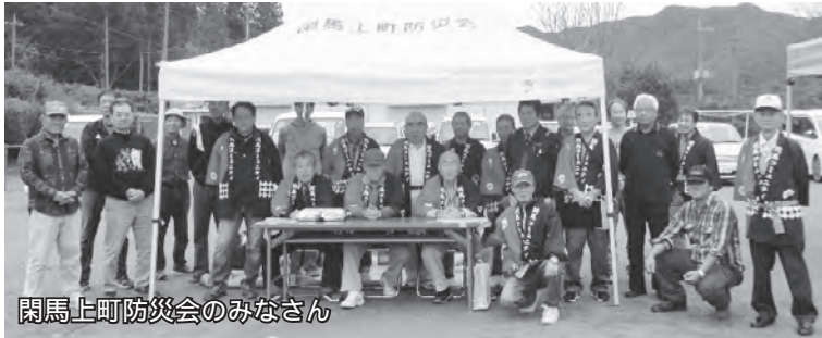
閑馬上町防災会のみなさん