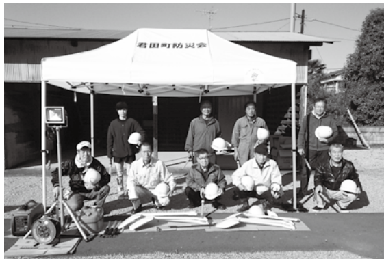
▲君田町防災会の皆さん

▼ 対象となる税など 令和元年度および令和2年度分の保険料または保険料であつて、令和2年2月1日から令和3年3月31日までに納期限が設定されているもの