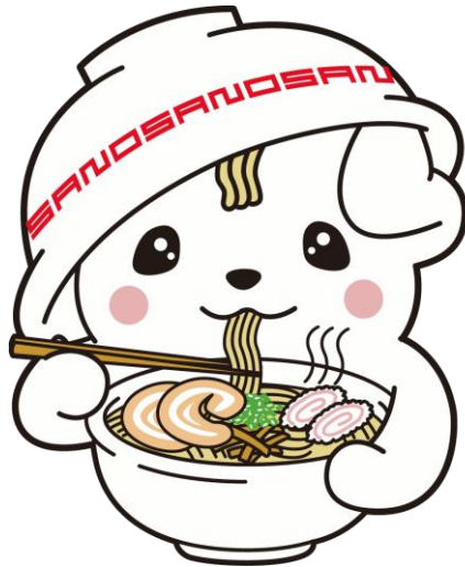
佐野ブランドキャラクターさのまる